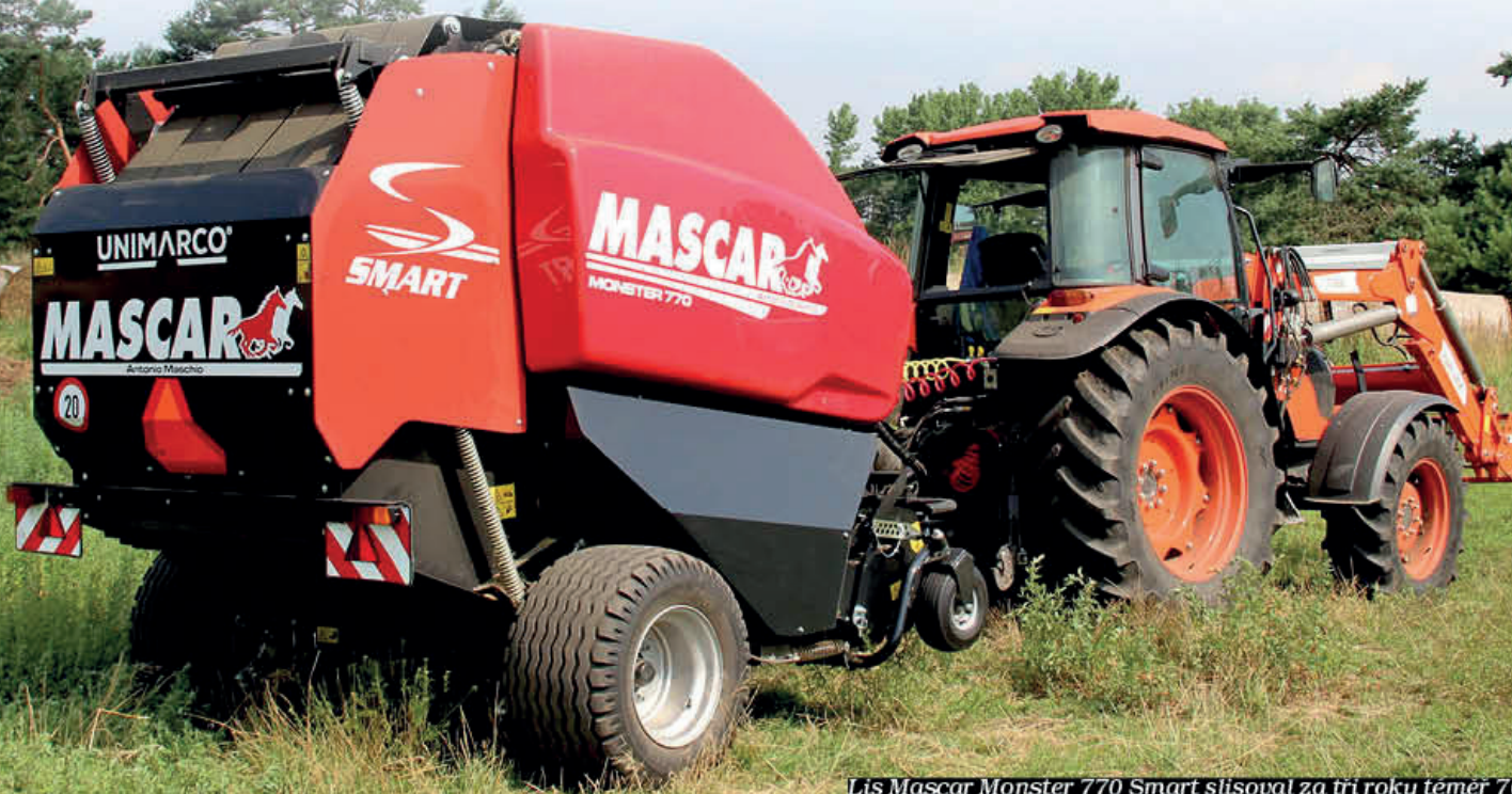
Lis Mascar Monster 770 Smart slisoval za tři roky téměř 7000 balíků

Již téměř historický traktor a letité stroje na sklizeň píce, které