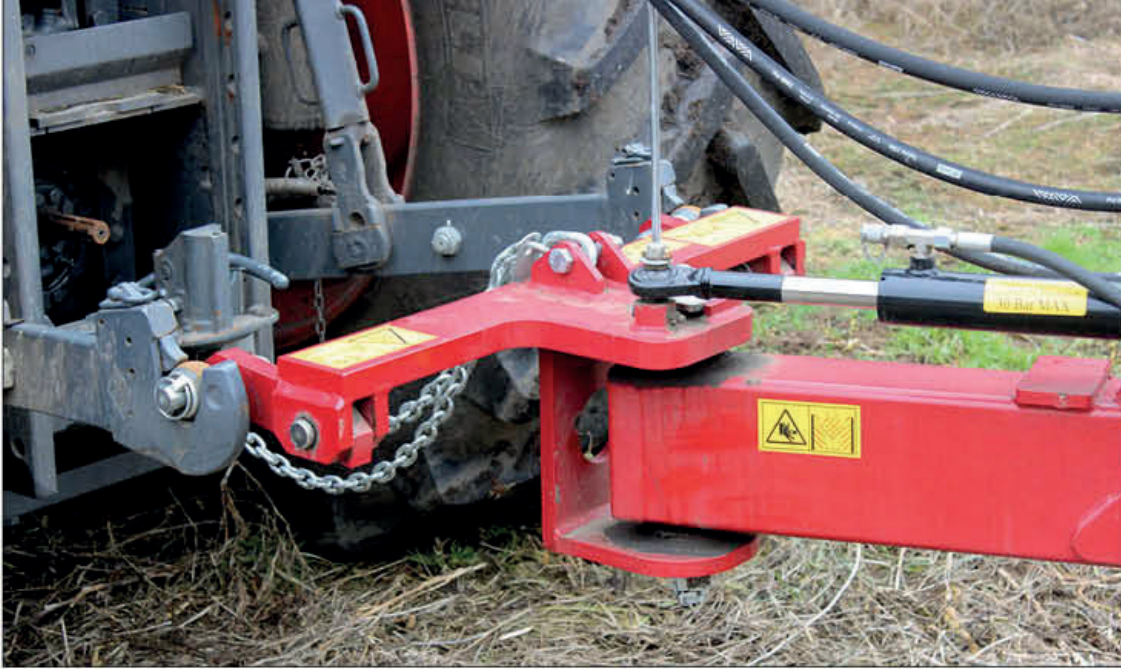
Dobře vymyšlené zavěšení stroje v ramenech třibodového závěsu

Původní představu o pracovním záběru shrnovače nakonec zamítl a zvolil největší „věčkový“ model.