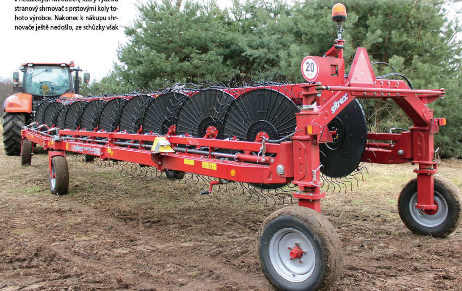
Shrnovač Sitrex Magnum MKE 20 Evolution s pracovním záběrem 11,4 m je největším modelem, jaký výrobce nabízí

V loňském roce došlo i na výše zmíněný shrnovač. Výběr značky dovedl farmáře opět do společnosti UNIMARCO a. s. „Srovnával jsem shrnovač Sitrex s konkurenčními výrobky, které měly nižší cenu, ale zjistil jsem, že jsou konstrukčně i provozně horší a jejich nákupem bych mnoho nezískal,” popisuje výběr vhodného stroje.