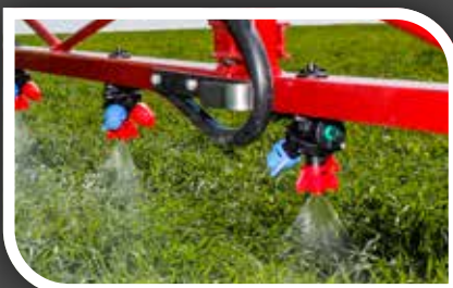
Držák trysek TRIPLET