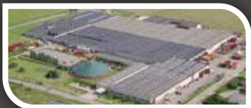
Nørre Alslev, Dánsko