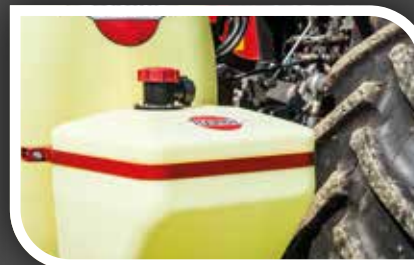
50 l proplachovací nádrž