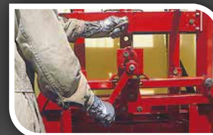
Manuální zvedání ramen