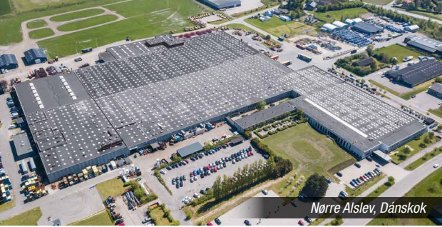
Nørre Alslev, Dánskok