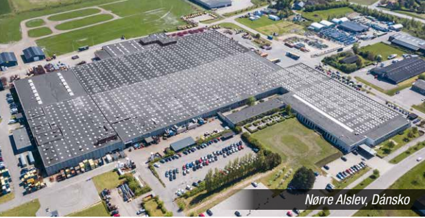
Nørre Alslev, Dánsko