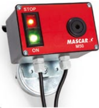
Ovládací box M50 Ovládací panel M50 Steuerung M50 Centralka M50 Компьютерный блок управления M50