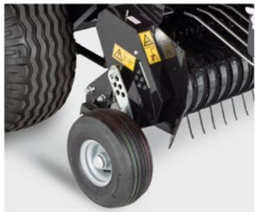
Otočná kola sběrače s jednoduchým nastavením Otočné kolesá zberača s jednoduchým nastavením Abnehmbare Pick-up Räder. Einfache Höhenverstellung der Pick-up Räder Demontowalne koła podbieracza z szybką regulacją Съемные колеса подборщика с быстрым регулированием