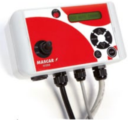
Automatické ovládání vázání M200 Automatické ovládanie viazania M200 Automatische Steuerung M200 Centralka automatyczna M200 Автоматическое управление M200