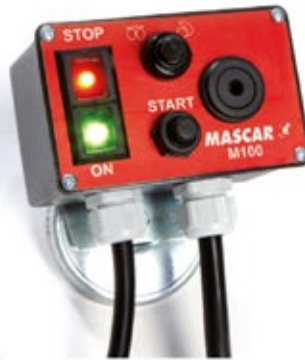
Ovládací box M100 Ovládací panel M100 Steuerung M100 Centralka M100 Компьютерный блок управления M100