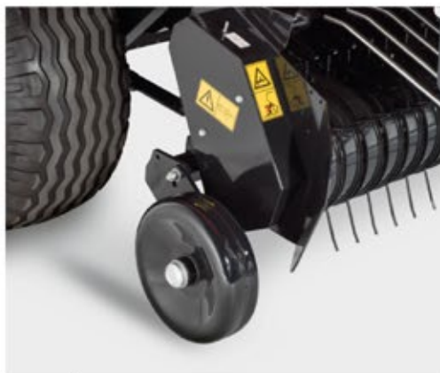
Ocelová kola sběrače Oceľové kolesá zberača Eisen-Räder des Pick-up Metalowe kółka podbieracza Железные колеса подборщика