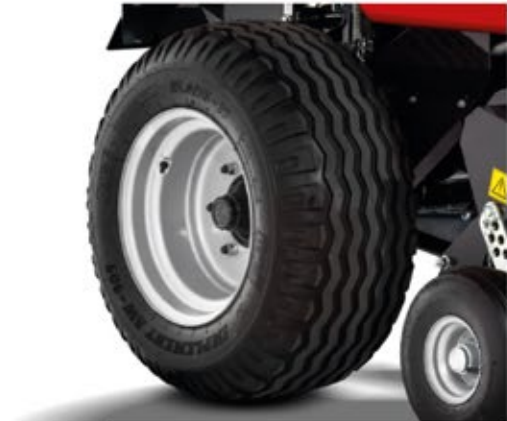
Kola 15" Kolesá 15" Reifen 15" Koła 15" Колеса 15"