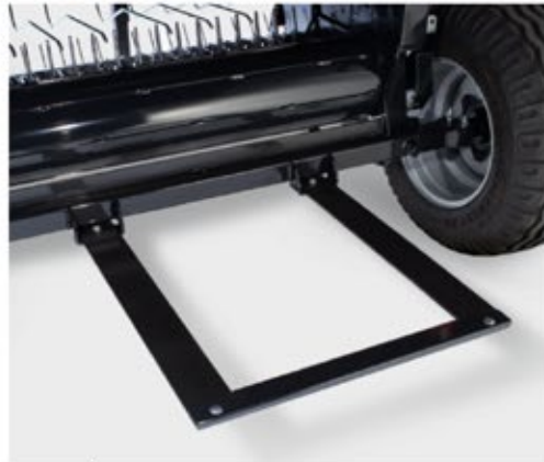
Vyhazovač balíků Vyhadzovač balíkov Ballenwerfer Wyrzucacz Выталкиватель рулонов