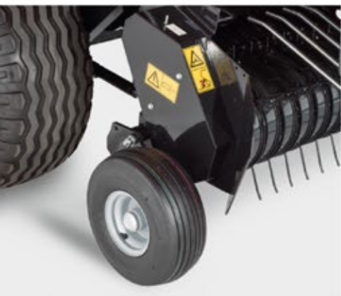
Kola sběrače s pneumatikami Kolesá zberača s pneumatikami Pick-up mit festen Rädern Szttywne koła podbieracza Подборщик с фиксированными колесами