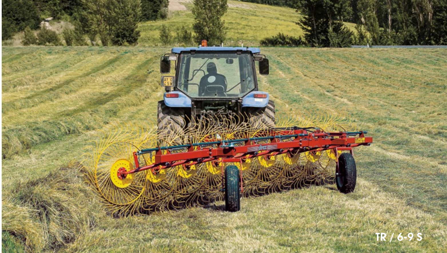
TR / 6-9 S