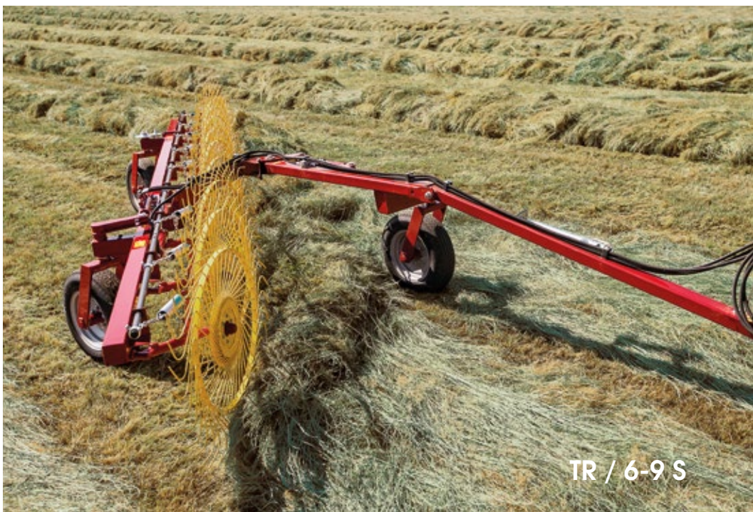
TR / 6-9 S

Stroj lze snadno přestavit z pracovní do transportní polohy a opačně pomocí jedné páky v kabině traktoru. Promyšlená konstrukce umožňuje minimalizovat celkové rozměry stroje v transportní poloze a současně plynulé nastavení pracovního záběru v závislosti na potřebách uživatele. Bezpečnostní ventily hydraulického okruhu zajišťují bezpečné zajištění stroje v transportní poloze a současně udržování nastaveného pracovního záběru v pracovní poloze. Pružiny ramen shrnovacích kol zajišťují dokonalé kopírování povrchu i v nejnáročnějších terénních podmínkách. Tento systém chrání rám stroje proti namáhání, které se přenáší od shrnovacích kol, zejména při kontaktu s cizím tělesem. Výše uvedené vlastnosti zaručují vysoký výkon při zachování nejvyšší kvality za každých podmínek.