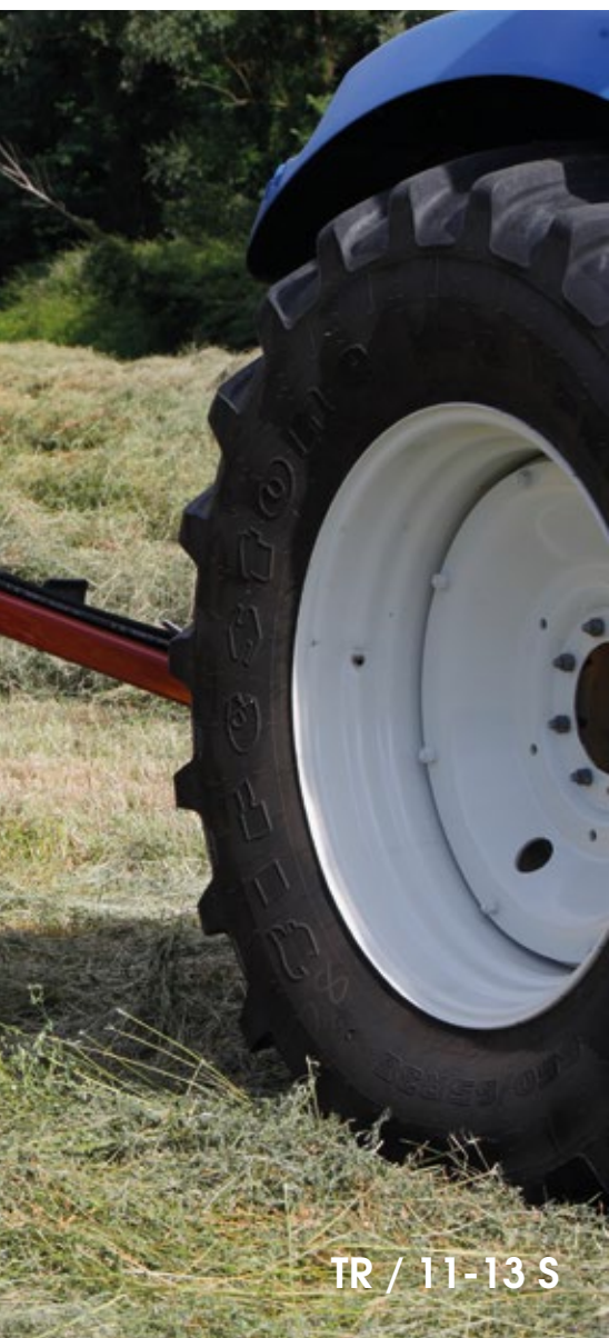
TR / 11-13 S